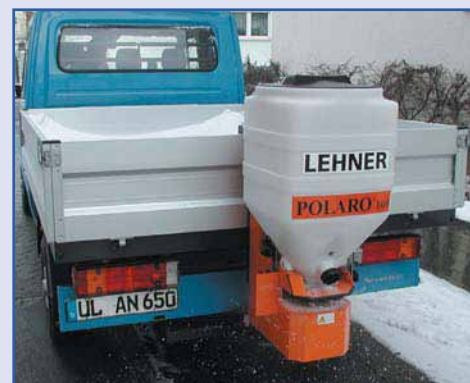
POLARO® 110 su autocarro