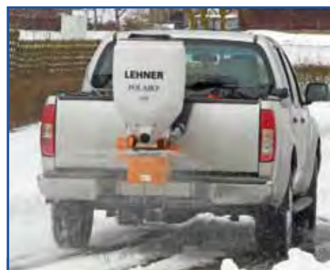
POLARO® 110 su pick-up