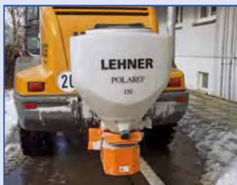
POLARO® 170 montato su pala con lama spazzaneve