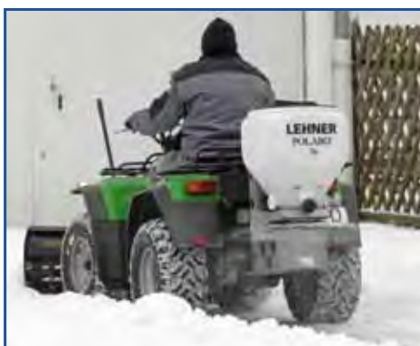
POLARO® 70 applicato su ATV con lama spazzaneve

Grazie al funzionamento a 12 volt il POLARO® può essere applicato su tutti i mezzi dotati di batteria.