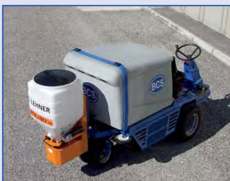
POLARO® 110 applicato su rasaerba