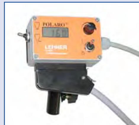
quadro di controllo

La quantità di flusso può essere regolata in modo continuo sul distributore. Grazie alla regolazione continua dei giri del piatto la larghezza di spargimento può essere variata durante la marcia da 0,8m (marciapiede) fino a 6m (fermata autobus, parcheggio).