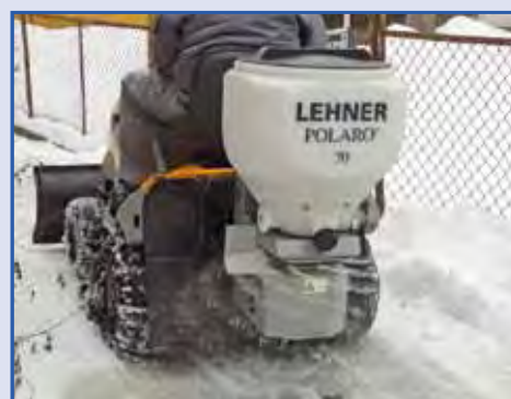
POLARO® 70 su trattorino con lama spazzaneve

Grazie al funzionamento a 12 volt il POLARO® può essere applicato su tutti i mezzi dotati di batteria.