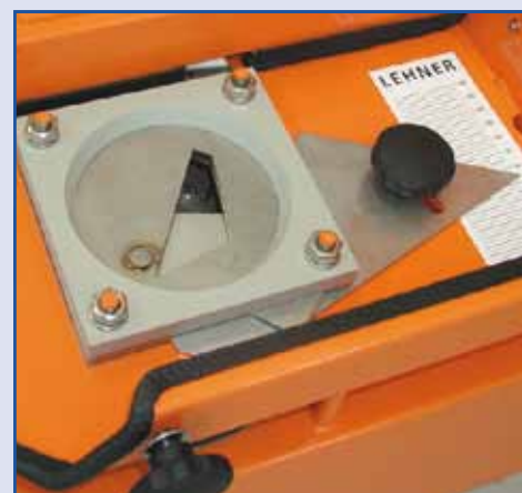
Particolare della saracinesca